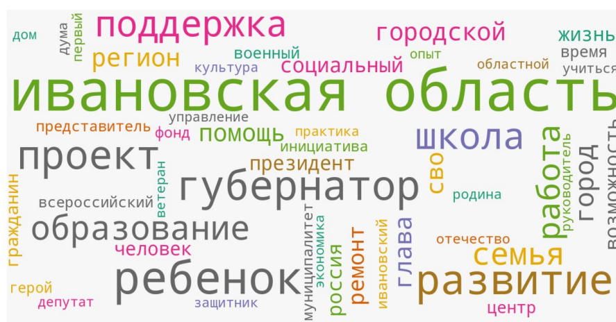
Рис. 3. Визуализация «облака слов» региональной политической повестки (топ-50 слов)

Визуализация (рис. 3) построена на основе словаря частот: размер слова соответствует его частоте, применяется цветовая карта для повышения различимости, многословные токены преобразуются в читаемый вид (замена _ на пробел в случае токена «ивановская область»).