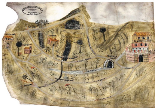
Рис. 6. Карта сеньорий Альби и Пуигузон, ок. 1314 г., пергамент, 71x86 см (Archives départementales de Tarn, 4 EDT II 5, fo 1 ro)

Также достаточно тесной была связь Альби с его округой, составлявшей внешнее пространство города, в противоположность пространству внутреннему, расположенному внутри городских стен [Ястребицкая: 247]. Достаточно отметить то, что одними из важнейших товаров, экспортируемых городом, были красильная вайда и шафран [Biget 1983: 100], выращиваемые на территориях вокруг Альби. Также в источниках встречаются упоминания о выращивании пшеницы, ржи, ячменя, овса, разведении свиней.