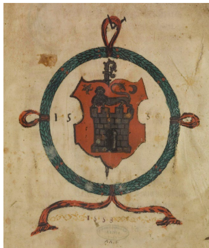
Рис. 9. Герб Альби, помещенный на первой странице картулярия 1536 г. (Archives départementales de Tarn, 4 EDT, AA 5, fo 1 ro)

С несколькими изменениями герб города сохранялся и в последующее время. На первой странице картулярия 1536 г. представлен герб в красном поле в виде башни с зубцами и воротами, на которой стоит лев, слева и справа от него находятся солнце и полумесяц, над гербом возвышается епископский посох [Archives départementales... AA 5: fo 1 ro]. Во Всеобщем гербовнике Франции, составленном в конце XVII — начале XVIII в. Ш. д'Озье, приводится похожий герб города в красном поле без епископского посоха, солнце оказывается в верхней левой части герба, в верхней правой появляется луна, стена превращается в серебряную каменную башню с одними закрытыми воротами и двумя окнами, слева и справа к ней примыкают две башенки меньшего размера с одними воротами, двумя окнами и флажками на крыше. Идущий лев находится над башней [Armorial général...: 305].