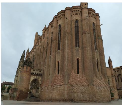
Рис. 2. Собор св. Цецилии, современный вид

Одним из наиболее значимых зданий в Альби был собор св. Цецилии. Он строился с 1382 по 1480 гг. [Biget 1983: 138; Crozes: 44] и располагался в историческом центре города, на месте античного сита. Строительство готического собора, внешне напоминавшего собой крепость, являлось одновременно символом победы католичества над катарской ересью и символом могущества епископа, являвшегося сеньором города [Орлов: 152]. Кроме этого, собор демонстрировал единство жителей города в качестве приверженцев католической церкви.