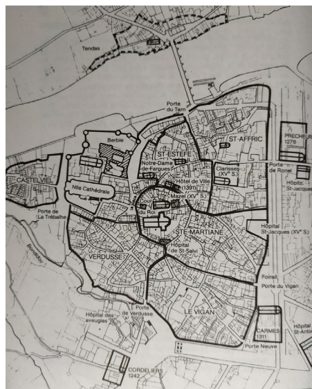
Рис. 1. Альби в Средние века (Biget J.-L. Histoire d'Albi, Toulouse, 1983)

Каждый квартал включал в себя главную улицу, которая обычно и давала ему название, и маленькие улочки, которые присоединялись к главной [Defolie: 20]. При этом ввиду тесноты улиц для Альби, как и для многих других средневековых городов, была актуальна проблема загрязнения [Leguay: 52].