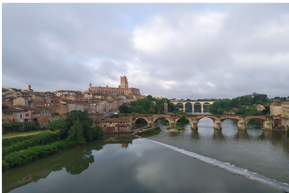
Рис. 4. Панорама Альби, на переднем плане Старый мост, современный вид

Мост являлся стратегически важной артерией, контроль над ним давал возможность осуществлять маневры и вести боевые действия на обширной территории Лангедока. По этой причине в источниках часто встречаются упоминания о военных отрядах, которые скапливались у стен города с целью пересечь мост [Douze comptes... 1: 57, 326, 336].