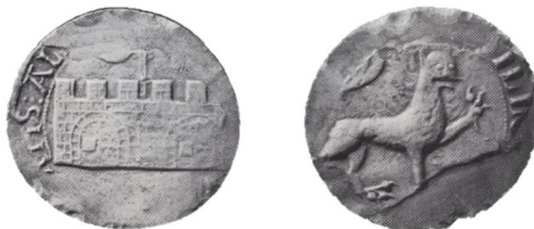
Рис. 8. Печать города 1303 г., диаметр 65 мм (Corpus des sceaux français du Moyen Âge, Éd. par B. Bedos, P., 1980, t. 1. Les sceaux des villes, pp. 44)

Зубчатая стена и посох указывали на военную власть консулов, подчинившихся епископу, леопард являлся символом силы. В конце XIII в. во время правления Бернара де Кастане идущий лев помещался над зубчатой стеной, так как в это время вместо вислой печати город начал использовать восковую печать, у которой не было оборотной стороны [Jolibois 1863: 8—9].