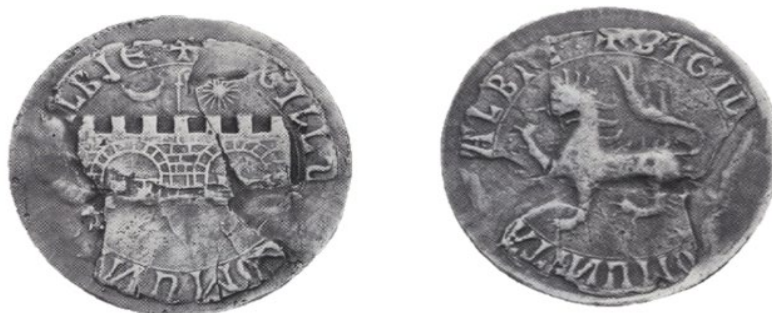
Рис. 7. Печать города XIII в., диаметр 72 мм (Corpus des sceaux français du Moyen Âge, Éd. par B. Bedos, P., 1980, t. 1. Les sceaux des villes, pp. 43)

Городское пространство Альби нашло свое отражение и в городской символике. На аверсах двух дошедших до нас печатей города XIII — начала XIV в. изображена зубчатая каменная стена с двумя закрытыми воротами. Над стеной возвышается епископский посох, слева от него изображен полумесяц, обращенный влево, справа солнце. На реверсах изображен идущий леопард. Печати сопровождаются следующими легендами: на аверсе первой «[SI]GILLU[M] COMUNI[TATIS A]LBIE», на реверсе «SIGIL[LUM C]OMUNITA[TIS] ALBIE.»; на аверсе второй «[...CIVIT]ATIS. AL[BIE]NSIS», на реверсе «[...]ILL[UM...]