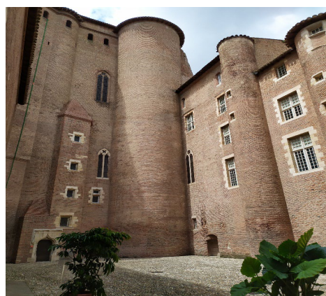
Рис. 3. Дворец Берби, внутренний двор, современный вид

Несокрушимость епископской власти демонстрировал также дворец Берби, построенный во второй половине XIII в. и являвшийся епископской резиденцией [Biget: 154]. Он примыкал к собору св. Цецилии с северной стороны и являлся частью системы городской фортификации. Отвесные стены епископского замка достигали 7 метров в высоту и спускались к берегу реки, надежно защищая город с северо-запада.