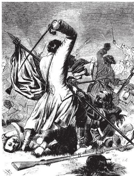
Рис. 4. Схватка за знамя

Продолжая тему отношения туркмен к иностранным флагам, уместно будет привести сведения Донована. В ходе упомянутого выше собрания текинцев Мерва 15 мая 1881 совет решил, что в ответ на обещания Донованом английской военной помощи необходимо водрузить британский стяг. Текинцы попросили Донована нарисовать образец флага для местного мастера. Однако