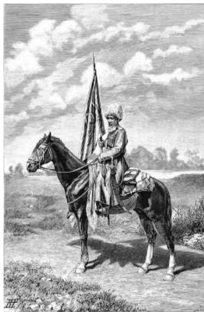
Рис. 3. Знаменщик текинской конной милиции. Рисунок В. Радомского

Интересные данные приводятся при описании продвижении отряда генерала А.В. Комарова по территории мервского оазиса в 1884 г. В ночь с 29 февраля на 1 марта произошло столкновение близ села Топаз. Тогда им навстречу выступил отряд сторонников Гаджар-хана в составе 200 конных и пеших воинов. Н.В. Чарыков указывает, что конные мервцы выступили со своим знаменем