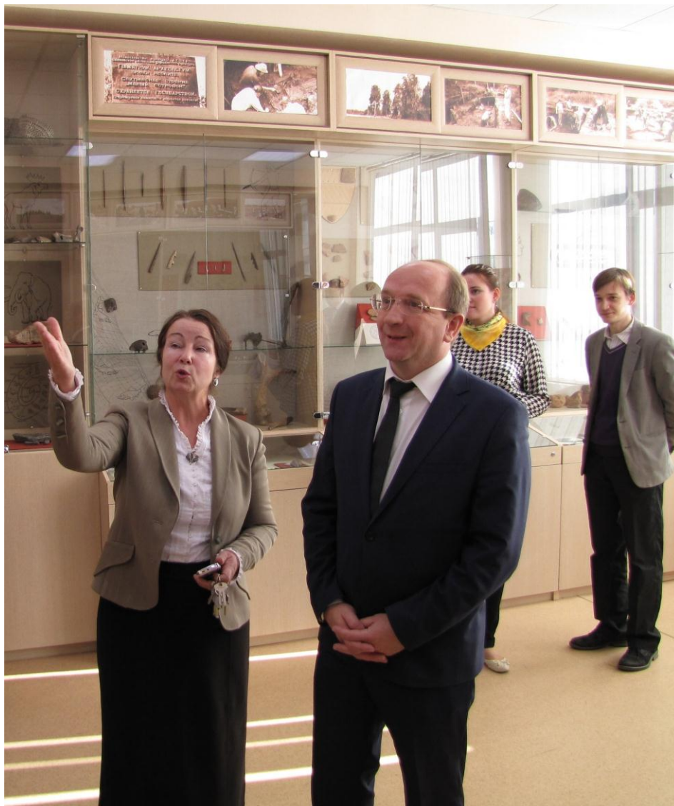
Археологический музей ИвГУ. Новая экспозиция принимает гостей, 2015 г.