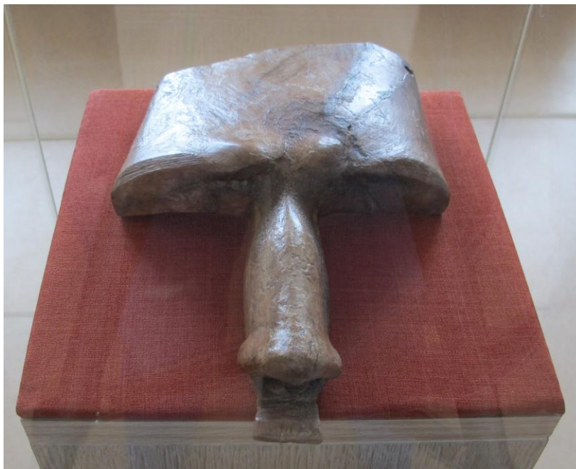
Сахтыш Па. Роговая маска-личина служителя культа предков из «святилища» № 1

В экспозиции представлена незначительная (примерно одна сотая) часть из коллекции АМ. Жемчужиной её является не имеющий аналогов единственный в мире экспонат, представляющий собой искусно вырезанную из основания рога лося с помощью каменных резцов маску-личину служителя культа предков. Она была обнаружена в 1990 г. в ритуальном сооружении — «святилище» на территории могильника волосовской культуры Сахтыш Па (III тыс. до н. э.) 2 . Этот экспонат представлялся на разных выставках, в том числе и в Государственном Эрмитаже, неоднократно публиковался в России и за рубежом [17, с. 31, рис. 34; 20, с. 67, 265, рис. 438, рис. V; 22, с. 132, рис. 69; 27, с. 29, рис. 3; 28, с. 128—129, рис. 12—14; 36, с. 111, рис. 150; 43].